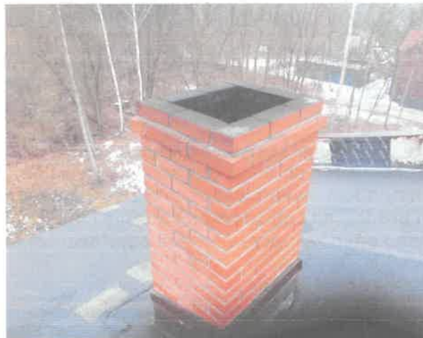
Komin ponad dachem w stanie bardzo dobrym

ZAKŁAD USŁUG KOMINIARSKICH z siedzibą w Dobrodzeniu, ul. Powstańców 5 tel. 34/ 3536-338 FILIA W ZABRZU! ul. Jajłowcowa 5/S, tel. 0 664 787 905