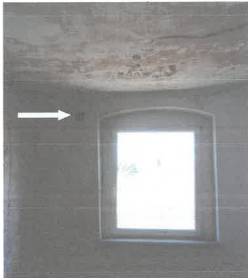
WK przez zewnętrzną ścianę budynku należy pozostawić