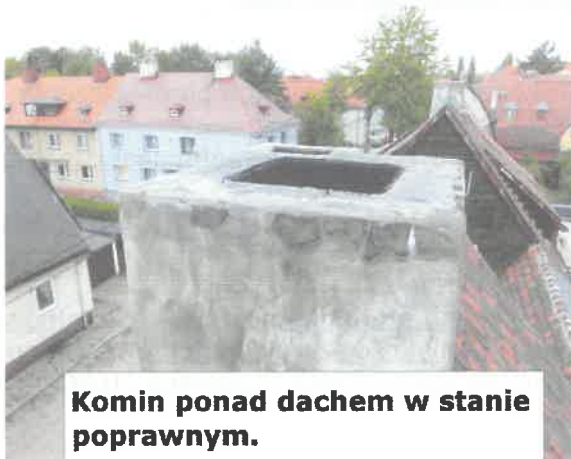
Komin ponad dachem w stanie poprawnym.