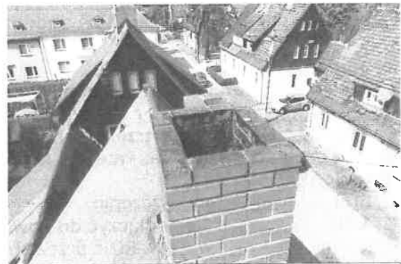
Komin ponad dachem w stanie bardzo dobrym