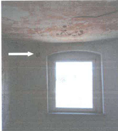
WK przez zewnętrzną ścianę budynku należy pozostawić