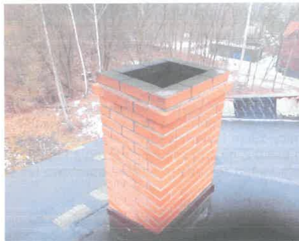
Komin ponad dachem w stanie bardzo dobrym

ZAKŁAD USŁUG KOMINIARSKICH z siedzibą w Dobrodzeniu, ul. Powstańców 5 tel. 34/3536-339 FILIA W ZABRZU ul. Jajłowcowa 5/5, tel. 0 664 737 900